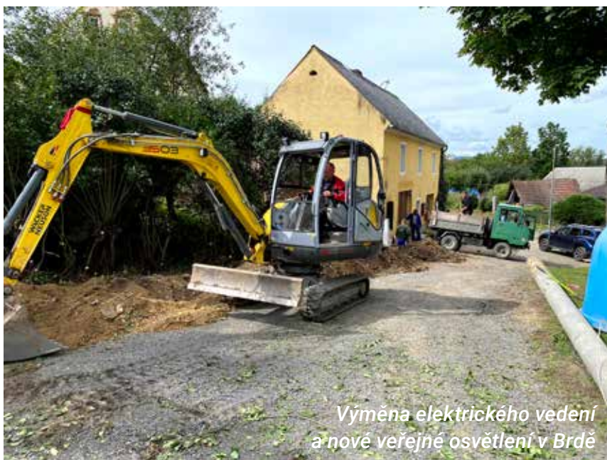
Výměna elektrického vedení a nové veřejné osvětlení v Brdě